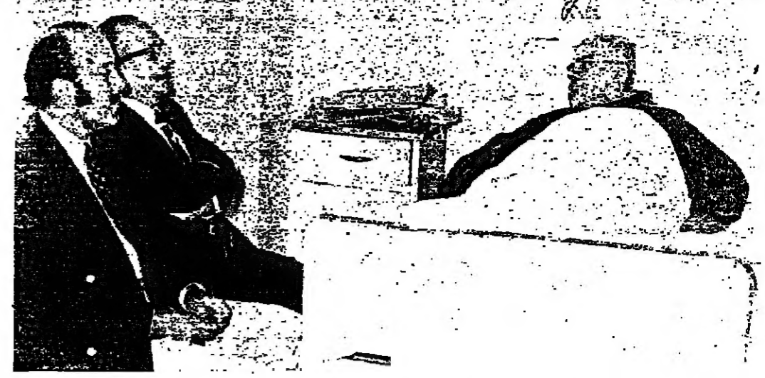
الرئيس الصلح والوزير سامي أثناء زيارتهما سيادة الطران يوسف الخوري في المستشفى امس

ادع: اما ان يرحل الصلح او يطرح الثقة بنفسه